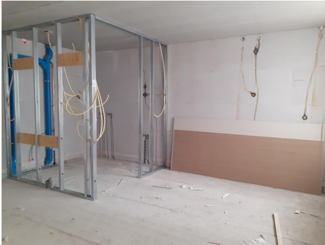
De contouren van het appartement worden zichtbaar: het stalen frame in de hoek wordt de badkamer. Op onderstaande foto is de voordeur te zien en een gedeelte van de badkamer.